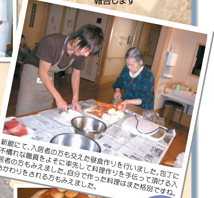
新館にて、入居者の方も交えた昼食作りを行いました。包丁に不慣れた職員をよそに率先して料理作りを手伝って頂ける入居者の方もみえました。自分で作った料理はまた格別ですね。おかわりをされる方もみえました。