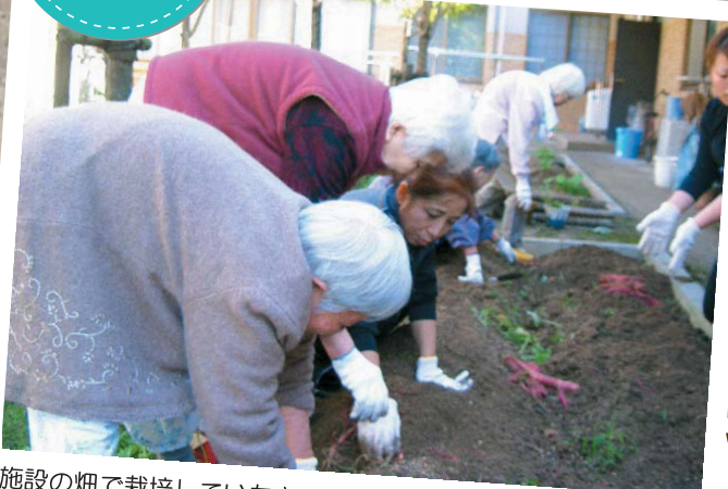
施設の畑で栽培していたさつま芋を入居者の方に掘って頂きました。芋の大きさは大小様々でしたが、晴天の下の作業は気持ちよかったです。午後のおやつには掘りたてのさつま芋を蒸かして食べて頂きました。自然の甘みを皆さん味わっておられました。