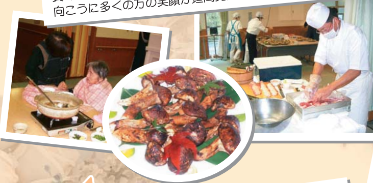
毎月実施のバイキング料理は入居者・利用者の皆さん楽しみにされています。10月は秋の味覚「松茸」に舌鼓を打ち、11月は寿司職人の方が施設に來られ握りたてのお寿司をご賞味頂きました。12月は冬の定番「鍋料理」でした！湯気の向こうに多くの方の笑顔が垣間見えました。