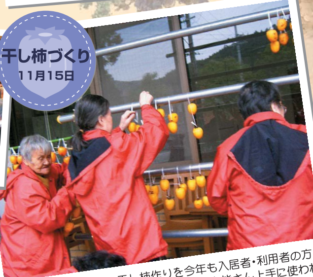
毎年恒例となりました干し柿作りを今年も入居者・利用者の方のご参加のもと実施しました。専用の皮むきを皆さん上手に使われ、たくさんあった柿もあっという間になくなりました。吊るす作業も手伝って頂き、あとは完熟するのを待つのみ。待ち遠しいですね。