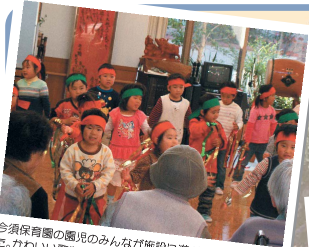
今須保育園の園児のみんなが施設に遊びにきてくれました。かわいい歌や踊りに入居者・利用者の方の心も和みました。一人一人と握手する企画も用意され、皆さん笑顔満面の1日でした。