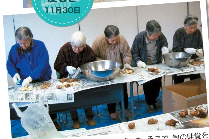
ご家族の方より立派な里芋を頂きました。そこで、旬の味覚を味わって頂こうと入居者の方総出で皮むきを手伝って頂きました。「この辺りではタロイモとも呼ぶね」と職員に教えて頂ける方もみえました。里芋は夕食に煮付けとして提供しました。